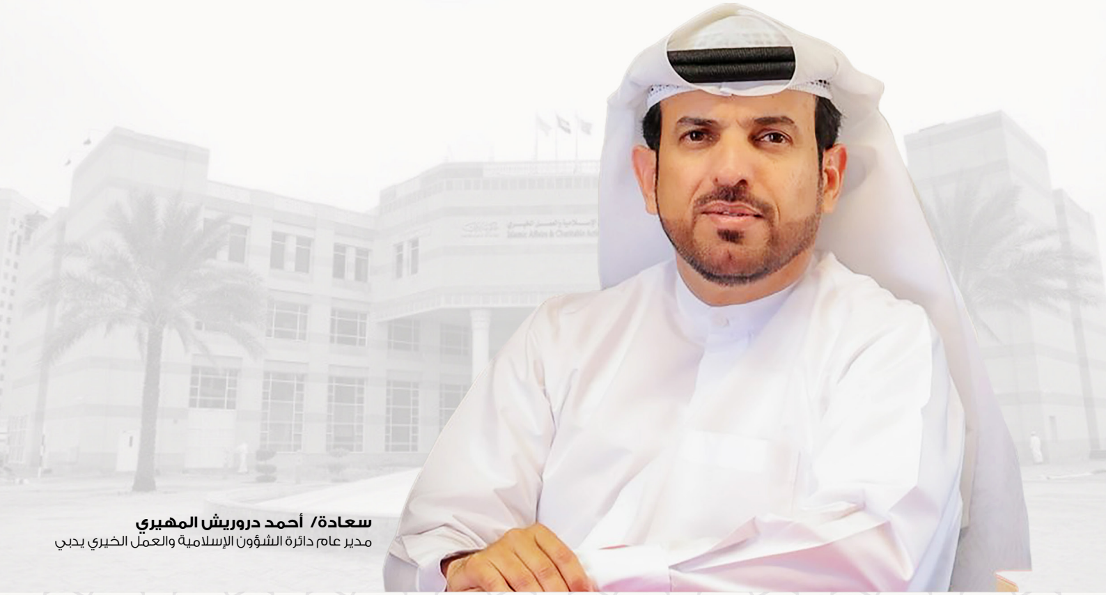
سعادة/ أحمد درويش المهيري مدير عام دائرة الشؤون الإسلامية والعمل الخيري بدبي